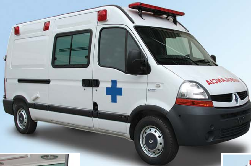
Master L2H2 UTI