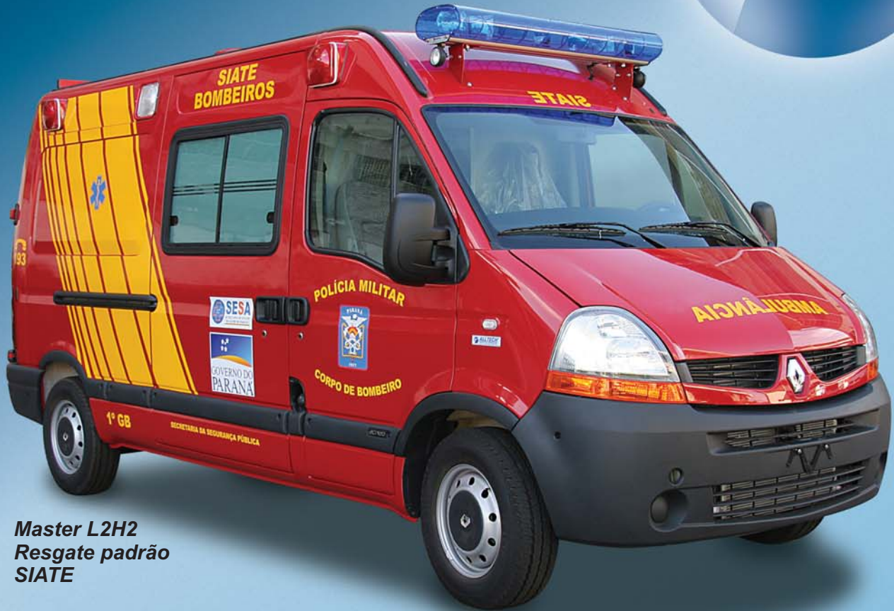
Master L2H2 Resgate padrão SIATE